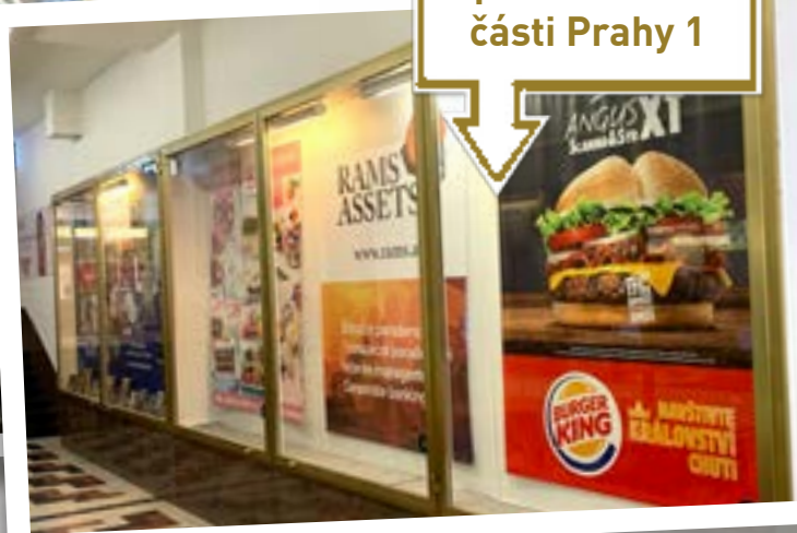
Strategická pozice v živé části Prahy 1

S trategická pozice v živé části Prahy 1 – pasáž Jalta spojující Václavské náměstí s ulicemi Politických vězňů a Opletalovou, reklamní vitríny na křižovatce vchodů do hotelu Grandium Prague, divadla Palace a knihkupectví Neoluxor, dále v těsné blízkosti hotelů Ramada a Jalta.