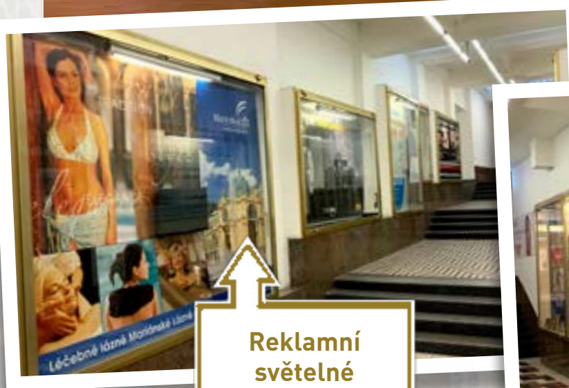
Reklamní světelné vitríny – 8 ks